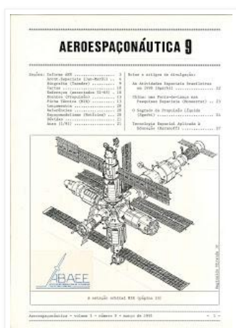
Capa do Boletim Aeroespacia número 9 (Mar/1991).

O Boletim AEROESPAÇONÁUTICA (AEN) foi lançado em outubro de 1988 através da ABAE (Associação Brasileira de Atividades Educativas Espaciais) . Ele teve 12 números em três volumes. O último número foi publicado em dezembro de 1991. Significado da palavra Aeroespacia: parte da ciência que estuda os minifoguetes.