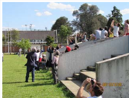
Público vendo um lançamento do Grupo de Foguetes Carl Sagan (UFPR).