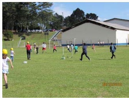
Criançada correndo atrás de um minifoguete que aterrissou.