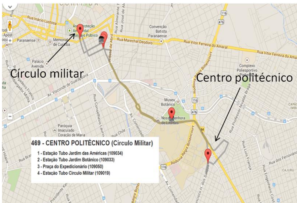
Figura 6. Percurso da linha de ônibus convencional “Centro Politécnico”.

O trajeto Centro Politécnico – Centro de Curitiba pode ser feito pela linha de ônibus convencional “Centro Politécnico”. Esta linha vai e volta do Centro Politécnico até o Círculo Militar, no centro de Curitiba. A Figura 6 abaixo mostra o trajeto e as estações tubo onde o ônibus faz paradas.