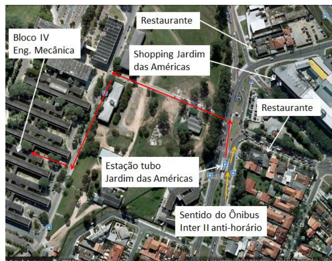
Figura 5. Desembarque do “Inter II Anti-horário” e opções de almoço / lanche nas redondezas.

Ao desembarcar na estação “Jardim das Américas”, saia dela e ande em frente por 30 metros. No semáforo atravesse à sua esquerda na faixa de segurança e estará na entrada de pedestres do Centro Politécnico (Portaria 3 na Figura 1), conforme pode ser visto na Figura 1 e indicado pelas setas vermelhas na Figura 5.