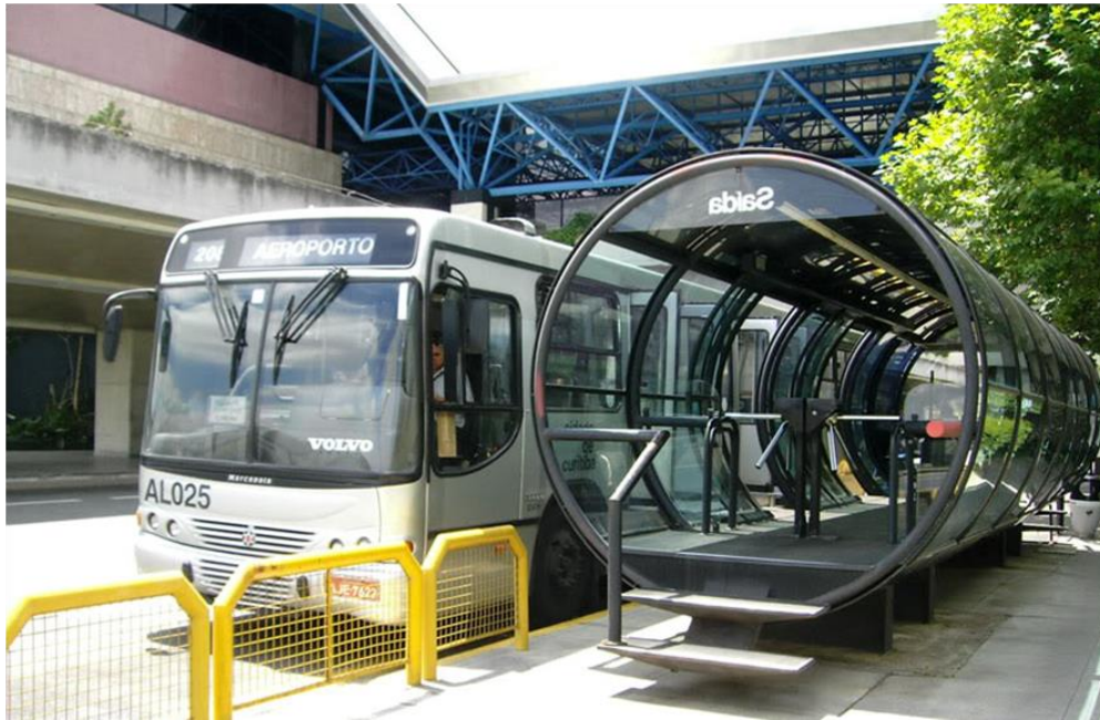
Figura 3. Estação tubo da linha “Aeroporto”. Ao fundo o terminal de acesso para embarque e desembarque de passageiros.

O valor da passagem é R$3,30 nos dias úteis, sábados e feriados e R$1,50 nos domingos. A passagem deve ser paga ao operador de catraca em uma das extremidades da estação tubo em que embarcar e não no interior do ônibus, como em muitos outros municípios. Há um serviço de voz indicando qual o próximo tubo a fim de auxiliar quem não conhece o trajeto. O passageiro poderá embarcar e desembarcar nas várias estações tubo e terminais, dentro dos quais poderá tomar outros ônibus sem ter de pagar outra passagem. Este ônibus em geral não opera muito cheio e dá para acomodar malas razoavelmente bem.