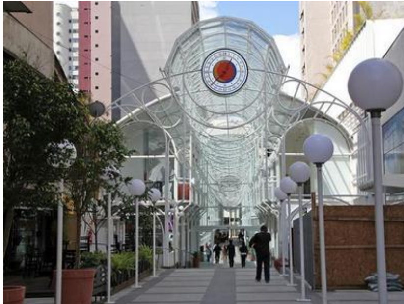
Figura 10: Entrada da Rua 24 h.

Rua ornamentada com arcos e o tradicional relógio. Comércio e serviços diversos.