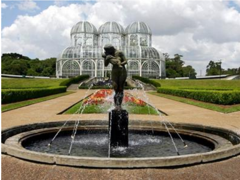
Figura 8: Jardim Botânico

Parque em forma de jardim. Contém uma estufa metálica onde estão plantadas diversas espécies representativas da flora nacional. Horário das 06:00 às 19:30h. Fica bem próximo ao Campus do Centro Politécnico.