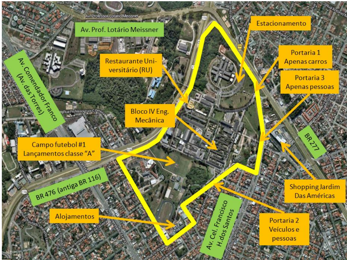
Figura 1: Vista aérea do Centro Politécnico da UFPR (delimitado pela linha fechada amarela).

Distância: 9,1 km (35 minutos de ônibus) até o centro de Curitiba.