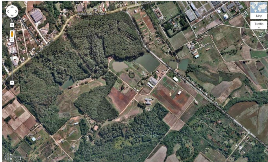
Figura 2: Vista aérea da Fazenda Canguiri, em Pinhais.

https://maps.google.com.br/maps?hl=en&ll=-25.387981,-49.128778&spn=0.007182,0.016469&t=h&z=17