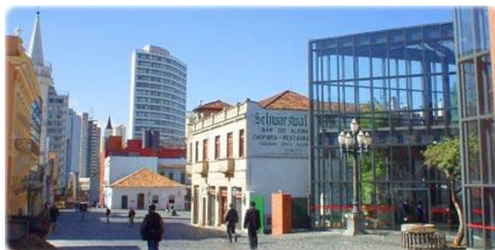
Figura 9: Vista parcial do Largo da Ordem

Localizado no centro de Curitiba, é uma rua onde se situam várias das construções mais antigas de Curitiba e sede de diversos bares e lanchonetes, como por exemplo, o tradicional bar do Alemão (SchwarzWald). Bastante movimentado à noite.