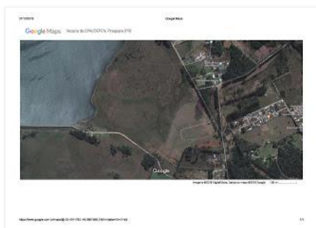
Local dos lançamentos das categorias X100h250 , H500 e H1k .

Dependendo da direção do vento, o ponto exato de lançamento poderá variar dentro de um raio de 50, 300 ou 500 m respectivamente em relação às coordenadas informadas acima.