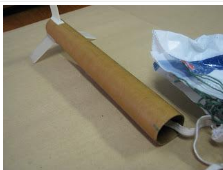
O módulo do minifoguete LAE-109 aonde ficam as empenas, motor, antichama e paraquedas.