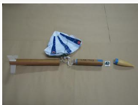
Componentes do minifoguete LAE-109: o módulo do motor e paraquedas à esquerda; o módulo (cápsula) do altímetro no centro seguido pelo próprio altímetro à direita e o nariz do minifoguete.