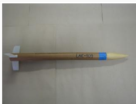
O minifoguete LAE-109 montado; para apogeu de 200 metros.

O mesmo exemplo do vídeo é mostrado nas fotos abaixo.