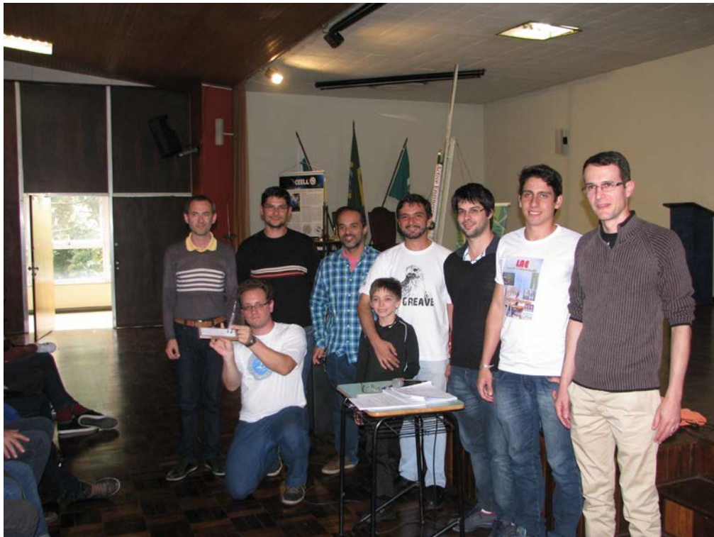
Membros da equipe Gralha Azul com o troféu de campeão da categoria 500 metros.