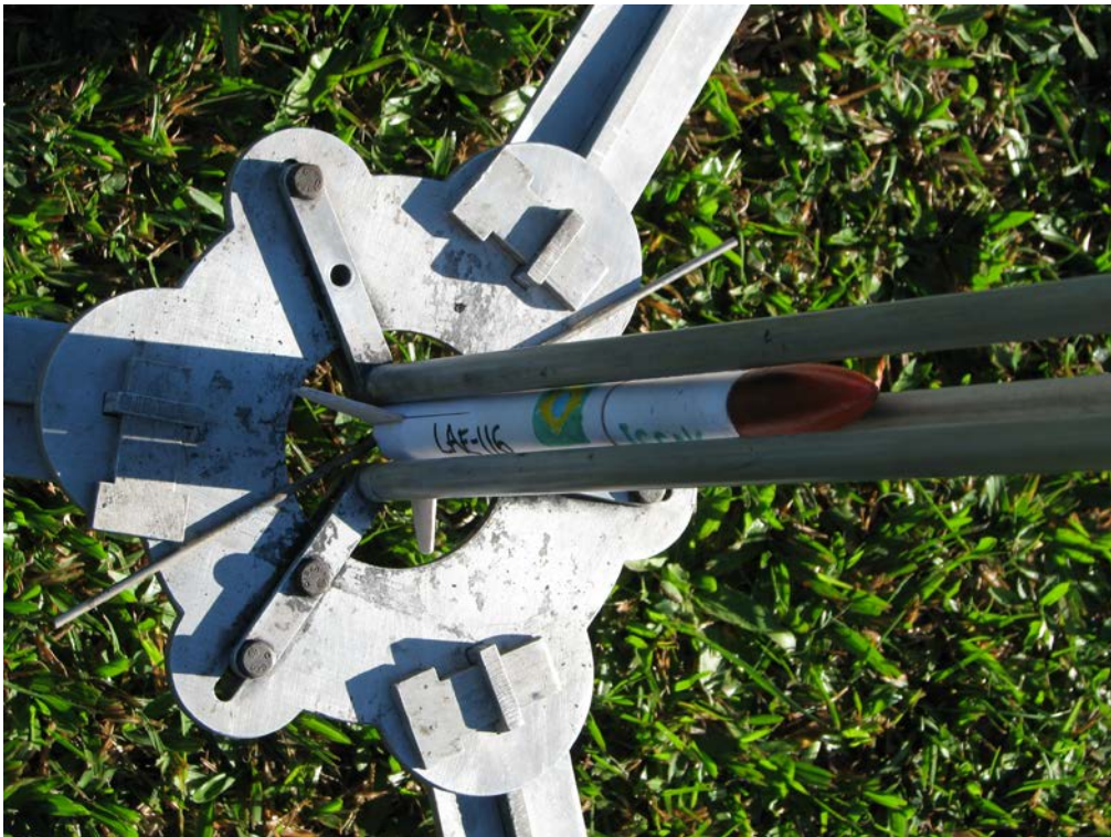
O minifoguete LAE-116 momentos antes do seu lançamento, já em sua rampa (campeão da categoria 50 metros).