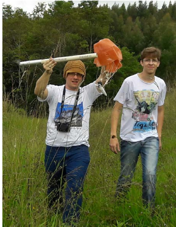
O minifoguete Netuno-R-Beta/Paraná-VI após o seu voo, resgatado por dois membros da equipe (campeão da categoria 500 metros).