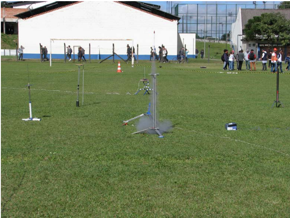
O minifoguete LAE-118 decolando, logo após sair de sua rampa de lançamento (campeão da categoria 100 metros).