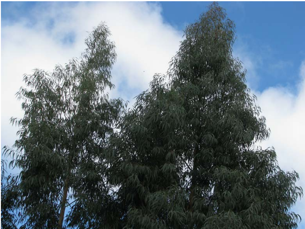
O minifoguete Netuno-R-Beta/Paraná-VI caindo de paraquedas entre as duas árvores (campeão da categoria 500 metros).