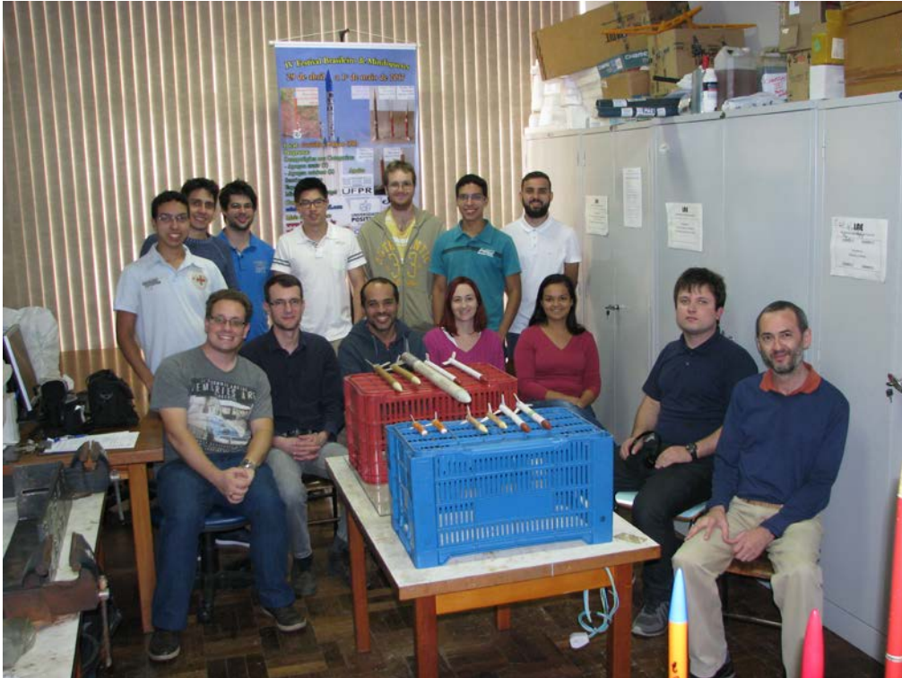
Membros do GFCS/UFPR com os minifoguetes usados no Festival 2017.

Abaixo são apresentadas algumas fotos de integrantes das seis equipes bem como dos minifoguetes premiados.